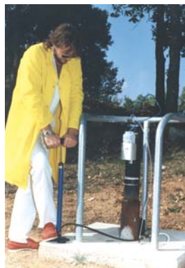
Surveillance des eaux souterraines

tillons à l'intérieur et à l'extérieur du centre. De plus, des contrôles pourront être effectués par des laboratoires d'analyses externes pour les services de l'Etat à l'instar des procédures existantes pour le centre de Cadarache.