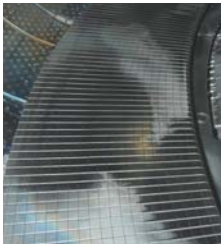
Le développement de composants résistant à des flux d'énergie très élevés a débouché sur des applications pour les freins et embrayages utilisés dans l'aviation, les chemins de fer, l'automobile...