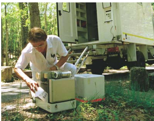
Prélèvement pour analyse autour du site de Cadarache

La conception de l'installation ITER, qui sera classée installation nucléaire de base, répond à des règles définies en application de recommandations émises par l'autorité de sûreté nucléaire française afin d'assurer la sécurité des salariés et des populations environnantes. Cela implique d'analyser les différents risques nucléaires, non nucléaires et externes (inondation, incendie de forêt...) afin de les maîtriser et de limiter leurs éventuelles conséquences. Dans ITER, toute modification de l'équilibre pression/température conduira à un arrêt immédiat de la réaction nucléaire. Par ailleurs, la quantité de combustible 3 sera inférieure à un gramme à l'intérieur d'un plasma, une trop grande quantité conduisant à un arrêt de la réaction. Plusieurs dispositifs, comme un système de récupération du tritium ou des filtres de haute efficacité au niveau du système de ventilation, seront prévus pour prévenir un éventuel risque de dispersion de tritium ou de poussières radioactives à l'intérieur des bâtiments, puis dans l'environnement, en cas de perte d'étanchéité de l'enceinte où le plasma est produit (chambre à vide).