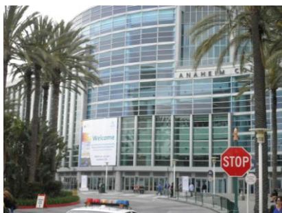
Anaheim Convention Center

NET2011 の プ ロ グ ラ ム は : http://abstracts.acs.org/chem/241nm/program/divisionindex.php?act=presentations&val=New+Energy+Technology&ses=New+Energy+Technology&prog=54111 にあります。