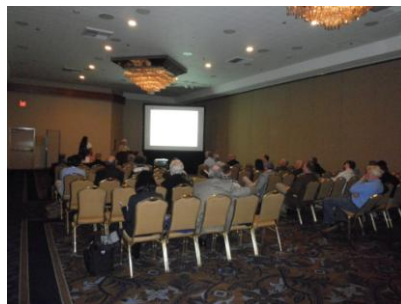
ACS-NET2011の会場、Sheraton P. H.

写真-2 : ACS 2 4 1 大会、2011 年 3 月 26-31 日、Anaheim でのスナップショット