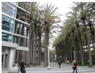
Anaheim Convention Center-2